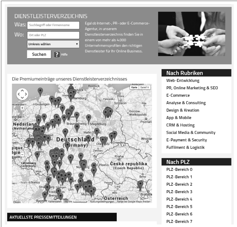
Abbildung 4-1: Dienstleisterverzeichnis

Ein Blick in die Referenzliste auf der Internetseite der jeweiligen Agentur lässt eine erste Einschätzung zu. Lassen Sie sich aber nicht zu sehr von Awards und Hochglanzprospekten blenden.